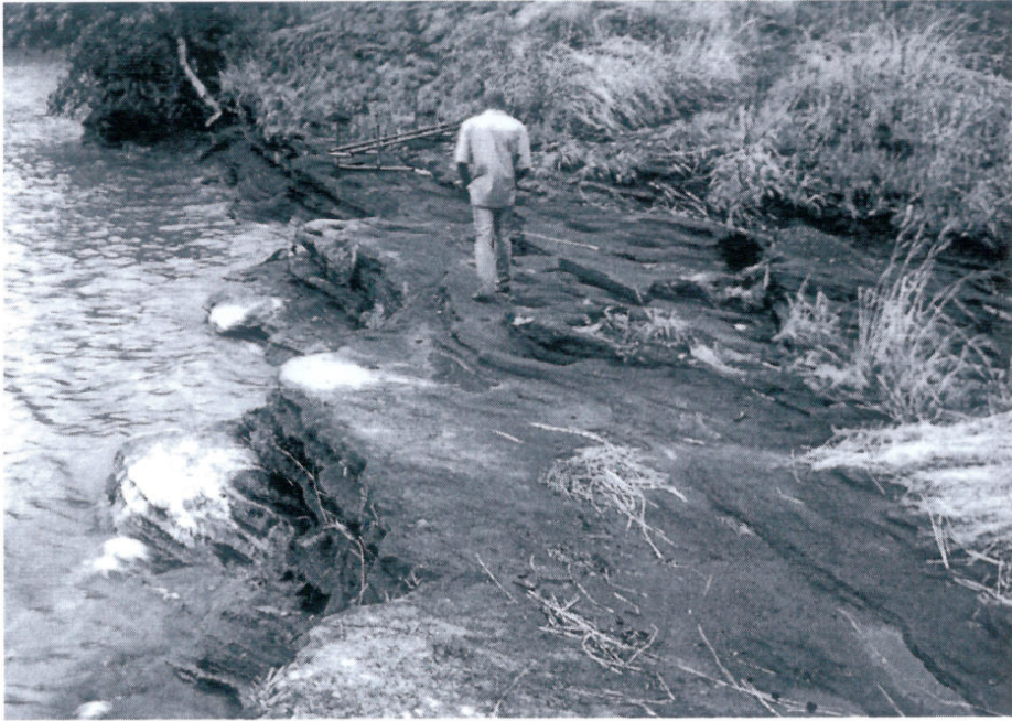
Une vue du barrage naturel qui présente des risques de cassure imminent